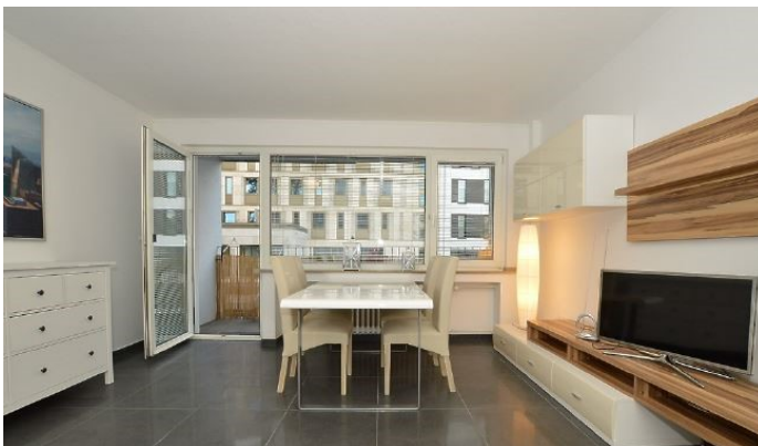
Essbereich + Balkon